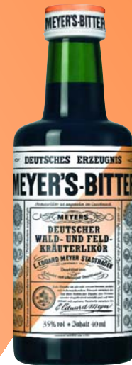
MEYER'S BITTER Deutsche Alpen-Kräuter